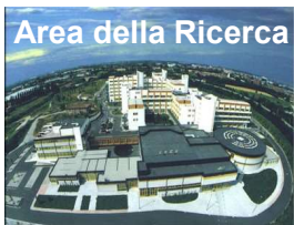
Area della Ricerca

Area della Ricerca, Via P. Gobetti 101, Bologna